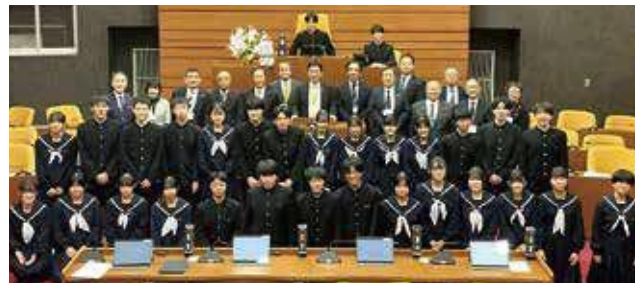
▲18日（木）3年2組の皆さん