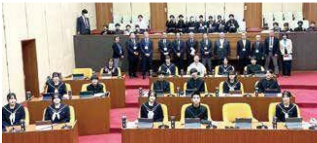
▲17日（水）3年1組の皆さん

12月17日と18日に臼杵市立北中学校3年生が、今回が初めてとなる議会体験会に来てくれました。議員から議会の仕組みを学んだり、議員に質問をしてみたり、模擬議会を体験したりと議場を体感し、議員と交流しました。