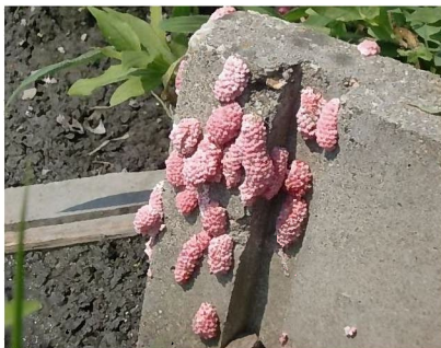
用水路（水口）の卵塊