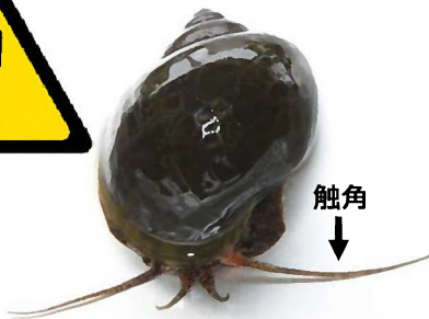
ジャンボタニシ (スクミリンゴガイ)