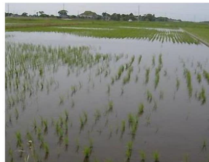
食害を受けた水田