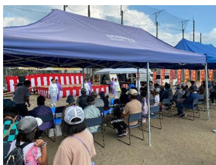
太極拳の発表の様子。最近の曲に振り付けをしておりました。