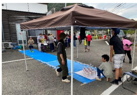
ゲームやバザーなども用意されており賑わっておりました！

寺子屋ん会(南野津地域振興協議会)が主催する「第27回寺子屋まつり」が10月22日・23日に開催されました！新型コロナウイルスの影響で中止を余儀なくされていましたが3年ぶりに開催することができました。公民館での各種教室の受講生によるステージ発表や豊後吉四六太鼓の演奏、細枝神楽による演舞など様々な内容で地域の活性化を図りました。まつりの最後には抽選会も行われ、子どもたちもすごく喜んでおり笑顔がとても印象的でした(^^)