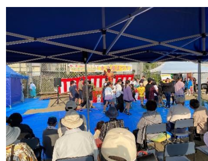
細枝神楽の様子。怖がる子どもが可愛かったです(笑)