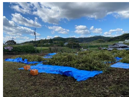
例年より早く終了したと事務局の方からお褒めの言葉が(^^)。