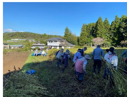
刈り取ったエゴマを運ぶ参加者の様子。

終了後には、「また企画してほしい!」、「他の地区の行事にも参加したい!」等大変ありがたいお言葉をいただきました。今後も色々な地区で開催していきたいと考えておりますので、つながら隊の皆さまも機会があれば是非ご参加ください!