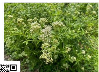
アサギマダラ来るといいですね(^^)♪