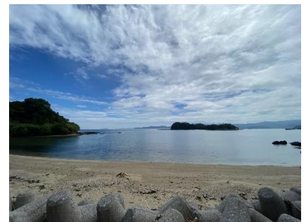
天気にも恵まれて撮影日和でした。