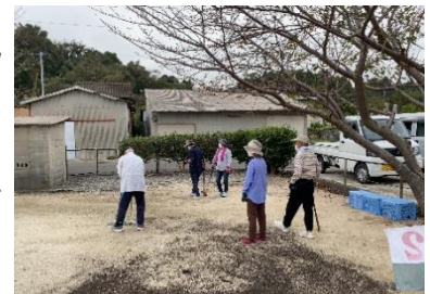
海を眺めながらグランドゴルフですね。