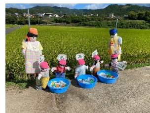
子ども園が作成した案山子