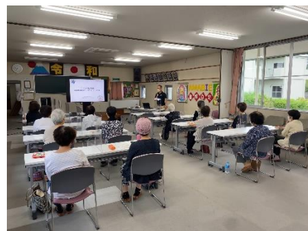
海辺連絡事務所にて行われました。

あまべ振興協議会の構成団体にもなっている“海辺婦人学級”は、学習会と題して、料理やカラオケ等の教室、防災活動、健康管理、研修等様々な活動を行ってきました。その歴史はとても長く、なんと今年で50周年を迎えました。近年は新型コロナウイルスの影響で学習会が中止になるなど思うように活動ができていませんでしたが、最近では感染症対策を徹底しながら活動を続けています。