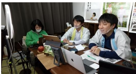
MC 陣の舞台裏！見事な連携でスムーズに進行することができました(^^^)