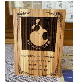
コミュニティセンターに盾が飾られています！

今年度も2月に実施予定でしたが、新型コロナウイルスの影響により延期となってしまう。3月に実施できるように現在準備中とのことです！