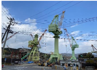
長きに渡って、様々な船を作っている下ノ江造船。