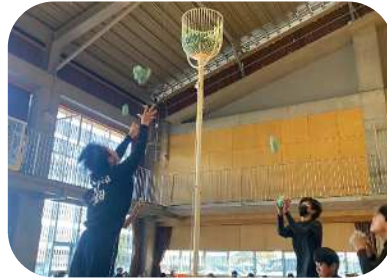
スポーツ玉入れ競技大会 (野津地区)