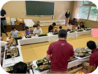
第1回目は野津地区コミュニティセンターにて昼食を食べました！

9月23日(土)と11月18日(土)に、白杵市に移住をされた若年・子育て世帯を対象とした「市内交流ツアー」が開催されました！9月は、4世帯14名の方が、11月は6世帯15名の方が参加されました。9月は、野津地域をまち歩きして、野津地区コミュニティセンターにて昼食・座談会などを実施しました。11月は、後藤製菓さんにて工場見学・手塗体験・ショウガの収穫体験、白杵おためしハウスにて「うさ味」さんの花盛り弁当をいただき、座談会を実施しました。大変好評だった本ツアー、来年度も開催される予定とのことです！