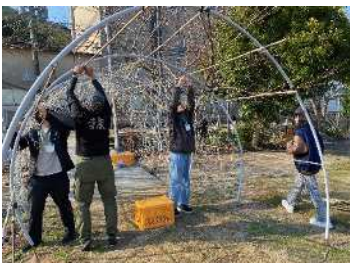
光のトンネルの作業

皆さんで試行錯誤しながら完成させたイルミネーションが、12月9日(土)より点灯されます！(1月21日(日)ごろまで点灯予定)なお、9日(土)は点灯式が行われ、16時半から模擬店販売、18時から点灯、18時半から打上げ花火という内容になっております。皆さんぜひお越しください♪