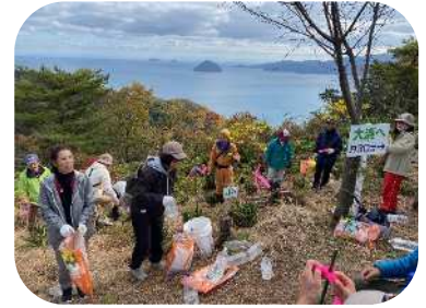
三角台つつじ植樹大会 (あまべ地区)