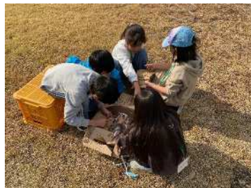
子どもたちはダンポ ールで工作(笑)