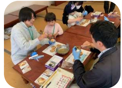
第2回目は後藤製菓さんで工場見学や白杵せんべいの体験などを行いました！