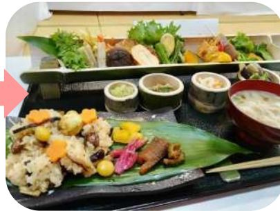
お昼ご飯は吉四六の里グリーンツーリズムの皆さんが振る舞ってくれました！