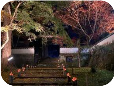
普現寺の紅葉ライトアップ