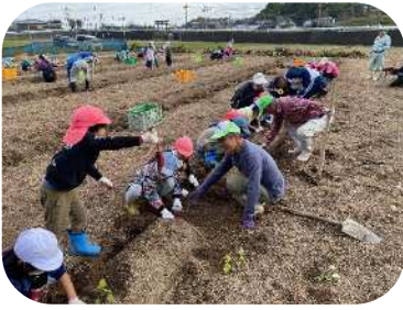
振興協議会たていし(下南地域)の 芋掘り体験