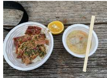
お昼にはりゅうきゅう 丼をいただきました