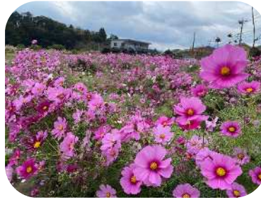
下ノ江地区のコスモス植花事業