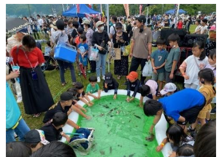
魚の触れ合いコーナーも！