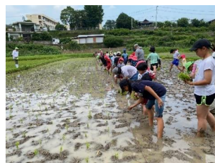
毎年綺麗なアジサイを見ることができます。梅雨時期ですが、晴れ日に撮影してきました！ 手際が良く、1時間弱で作業は終了しました。