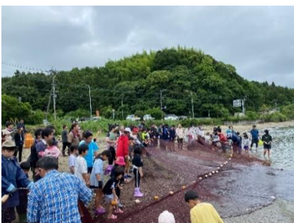
下ノ江地区の地引き網の様子

続いて、上浦・深江地区の「シン・大漁まつり」です。子育て世帯を中心に、1,000人以上の来場がありました！魚のつかみ取りや釣り堀体験のほか、出店の出店もあり大変賑わいました！