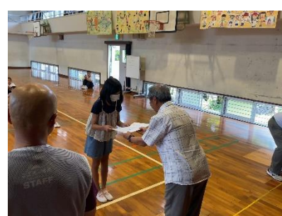
写真は移動支援で使用する車両のネーミング発表会の様子。海辺小学校の児童に募集をかけ、定期便に使用する車両は「あまべスマイルバス」、生活支援で使用する車両は「あまべた一助(すけ)号」に決定しました(^▽^)/