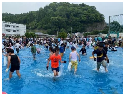
巨大プールで魚のつかみ取り！