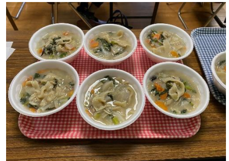
食部会の方がご用意してくださった団子汁。 美味しく頂きました！