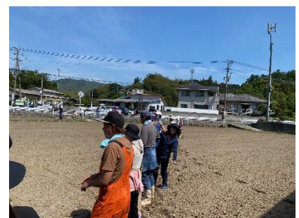
恒例のサークル上の植え付けをしました！

今回植えたひまわりは40日で開花する種類なので、6月に入れば見頃を迎えそうです。地区の方約50名で作業を行いました。子どもたちも参加しており、種をまく姿が可愛かったです(^^)