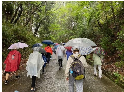
終盤に待ち構えていた急坂！ きつかったです(笑)