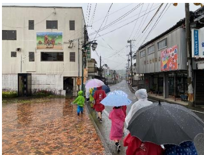
野津市の商店街を通り、国道へ・・・

雨だったからこそ見えた景色があったと思いますし、「あの時雨の中歩いたね(笑)」等と忘れられない思い出になっていたら嬉しいなと感じました。晴れの日と同じコースを歩いてみると、また違った発見があるかもしれません。次回開催が楽しみです！