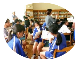
読みきかせの練習 をしているところ