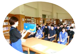
『バナナです』を 読みきかせ