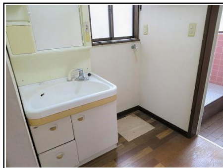
洗面 & 洗濯機置き場