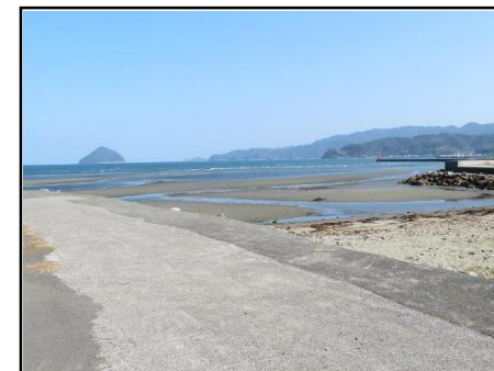
物件付近からの眺望