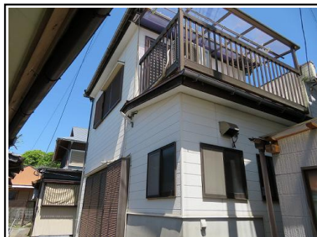
別角度からの外観