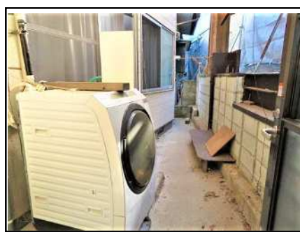
洗濯機置き場(屋外・勝手口横)