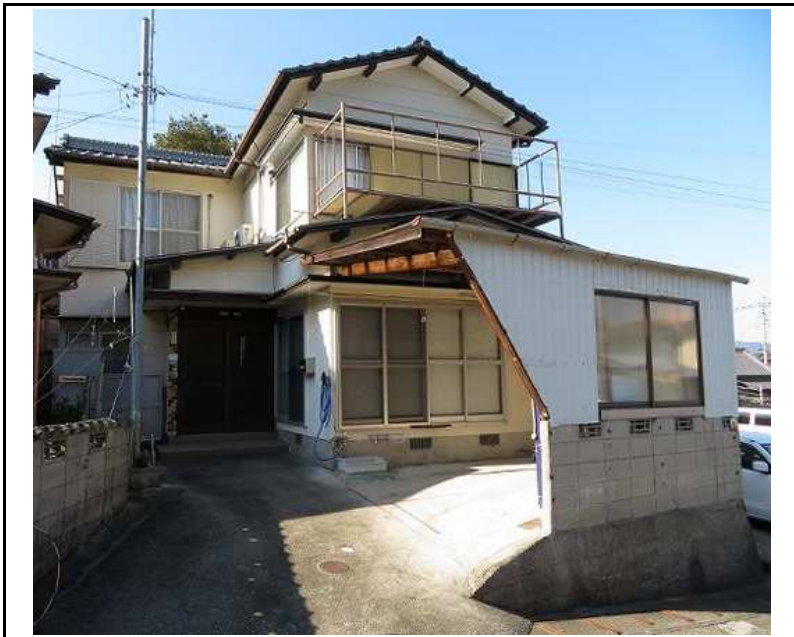
主要施設へのアクセス