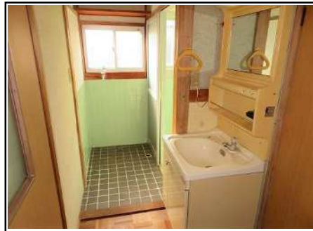
洗面所 & 洗濯機置き場