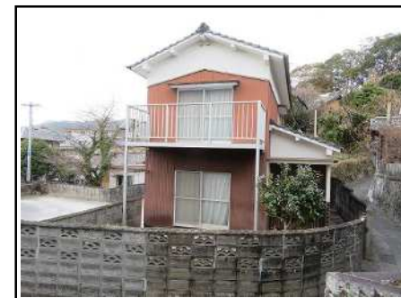
別角度からの外観