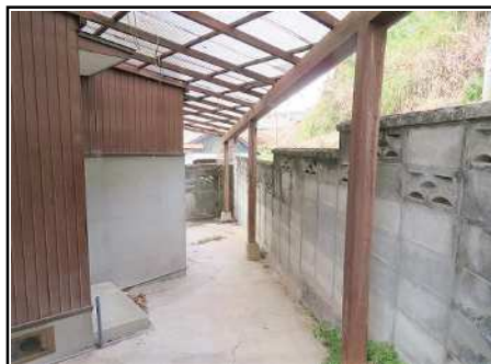
勝手口側(物干し場)