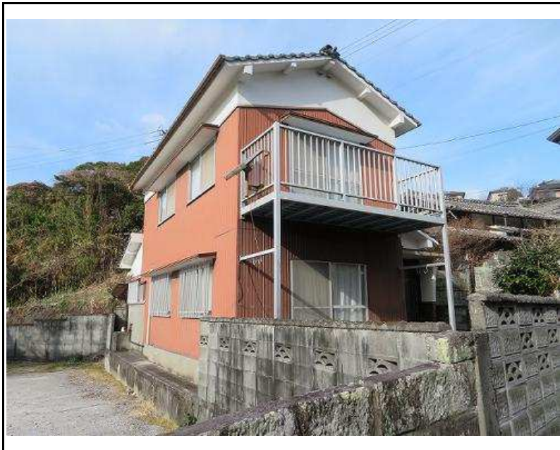
主要施設へのアクセス