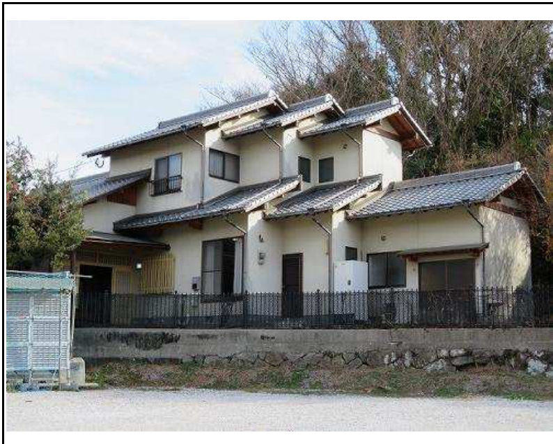
主要施設へのアクセス