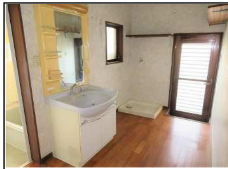
洗面脱衣所 & 洗濯機置き場