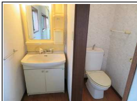
洗面所 & トイレ(2階)