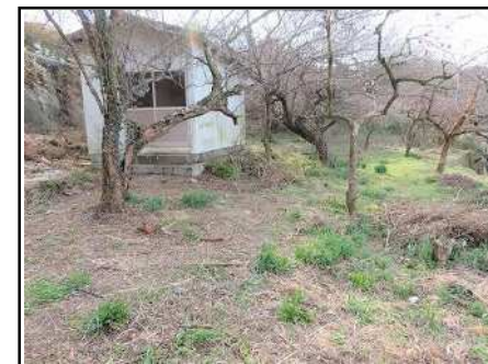
畑 & 物置(隣接地)