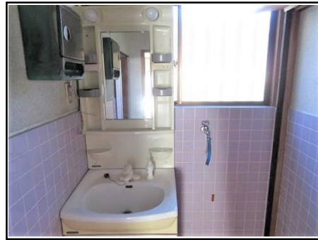
洗面 & 洗濯機置き場