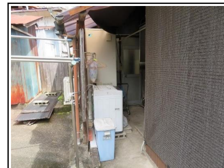
洗濯機置き場(屋外)