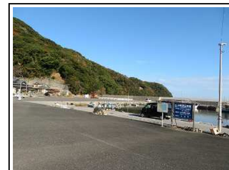
駐車エリア(地区の漁港)