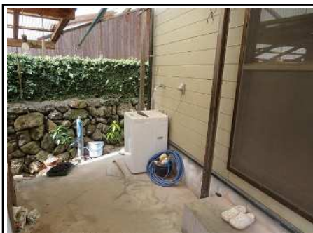
洗濯機置き場・干しスペース