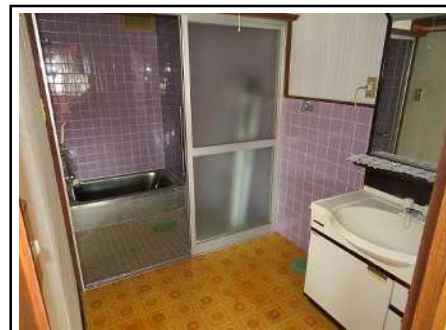
浴室 & 洗面所(2階)