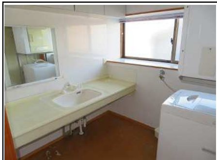
洗面 & 洗濯機置き場(3階)