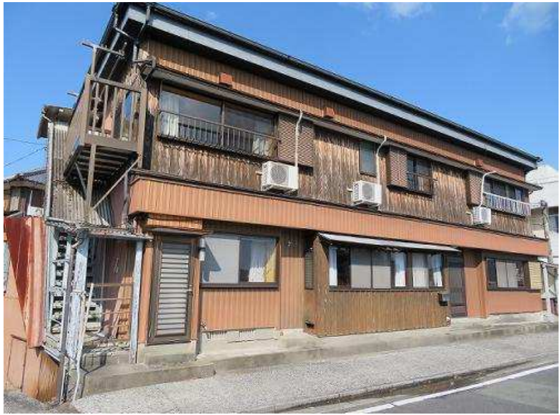
主要施設へのアクセス