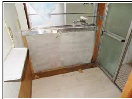
脱衣所 & 洗濯機置き場