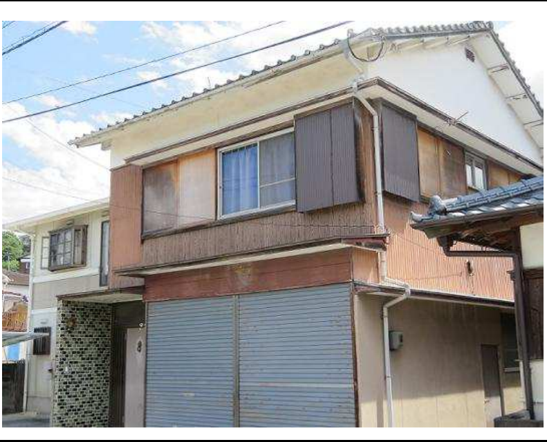
主要施設へのアクセス