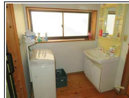
洗面台 & 洗濯機置き場