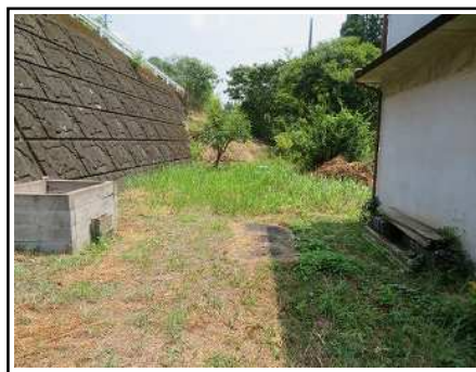
畑 & 庭