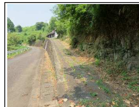
物件までの進入道路