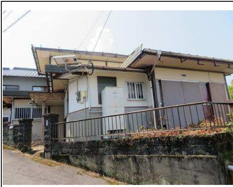
主要施設へのアクセス