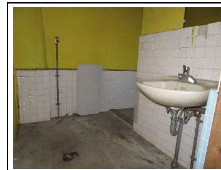
脱衣室・洗濯機置き場