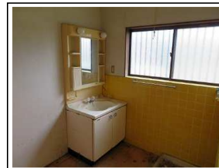
洗面所 & 洗濯機置き場