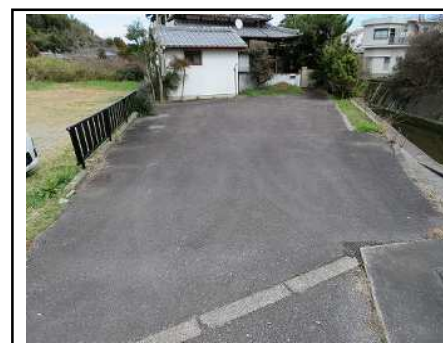
駐車スペース(5~6台分)