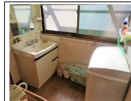
洗面所&洗濯機置き場