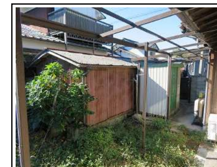
庭(物干しスペース・物置)