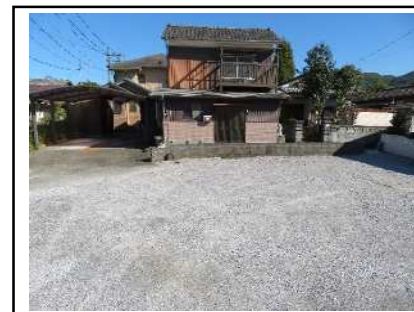
物件前の月極駐車場