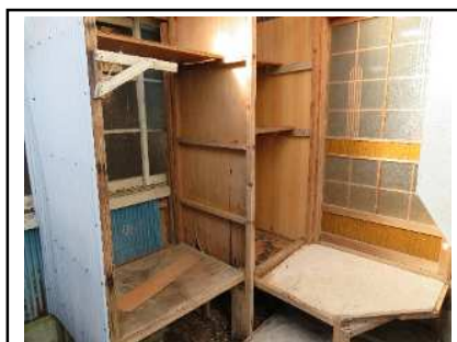
外部物置スペース