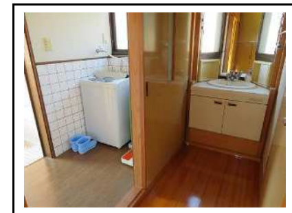
洗面所・洗濯機置き場