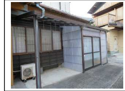
物置・物干しスペース