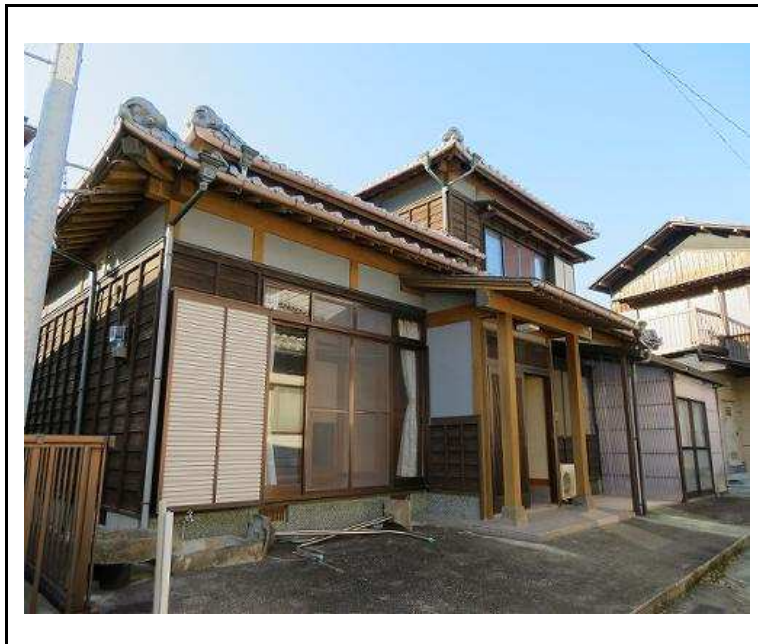
主要施設へのアクセス