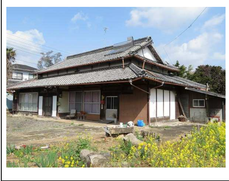
主要施設へのアクセス