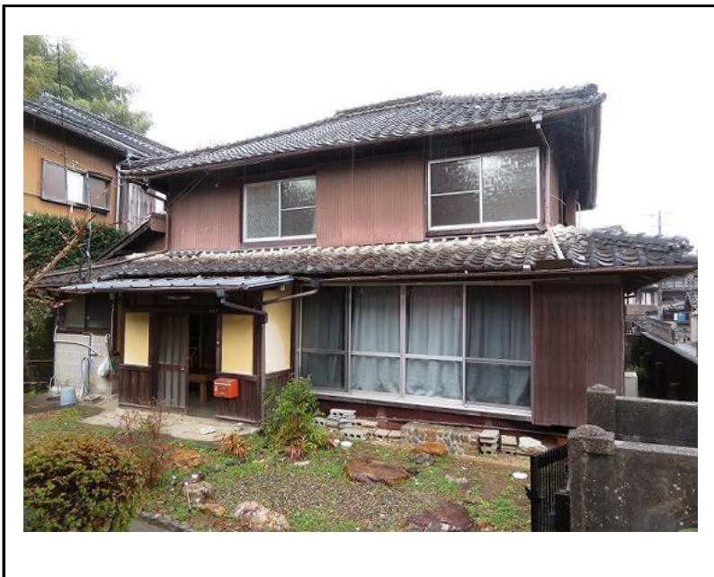
主要施設へのアクセス