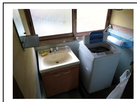
洗面所・洗濯機置き場