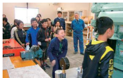
エンジンの運転を体験