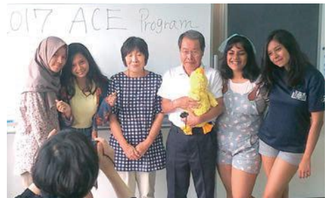
2年前はあどけない笑顔♪