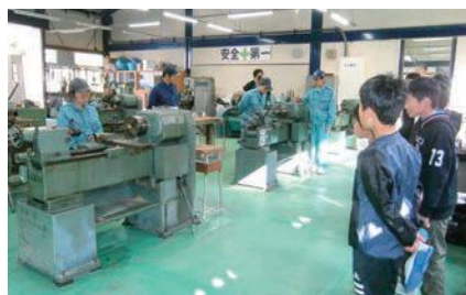
旋盤を使った金属加工を見学