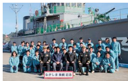
「ながしま」を背景に集合写真