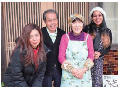
新しい『家族写真』が増えました♪