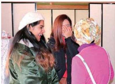
再会の感激、涙と広がる笑顔♪

AIの時代になっても人との繋がりは、人の心の潤滑油になるようなとても素敵なもの。皆さんも、農泊家庭になってその感激を味わいませんか？