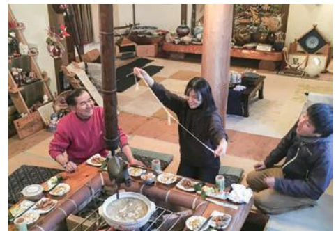
▲とある仕事で農泊取材。先人の知恵や人生の先輩の言葉をありがたくいただきました

先日、正規雇用で20年以上子育てしながら仕事をしているママ友と、この話で盛り上がりました。その方は何万回と仕事を辞めようと思ったそうですが、自分が仕事と子育ての両立で辛い時に助けてくれた後輩たちが、いつか自分と同じ立場になった時にフォローしてあげるために続けていると教えてくれました。そんな世界からドロップアウトした私は、胸が締め付けられる想いでした。働くママたち取材している同業者の男性曰く、「ママ業ってスポーツで例えて言うなら、朝はラグビーして、昼間は野球して、夜はテニスを常に全力でしている。それぞれ異なる体の使い方とルールのもと、脳と筋力を1日のサイクルでフル活用しているようなものだ」と。この手の話はワーキングママやワーキングパパだけでなく、老老介護や認知介護と言った介護問題など、すべての年代に当てはまってゆくものだと思います。あるミュージシャンたちがLGBTの世界を表現しながら、「イレギュラー」や「愛」を唱えていました。歌詞から拾った言葉で「完全に分かち合うより、曖昧に悩みながらも認め合えたら」と。完璧のない世界だからこそ、ほんの少しでも“おすそ分けできる愛”を持っていれば、どんな問題も解決の糸口は必ずあると信じています。