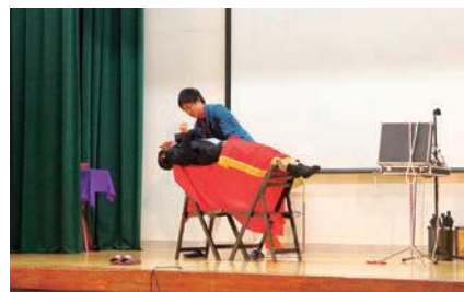
マジックショー (空中浮遊)