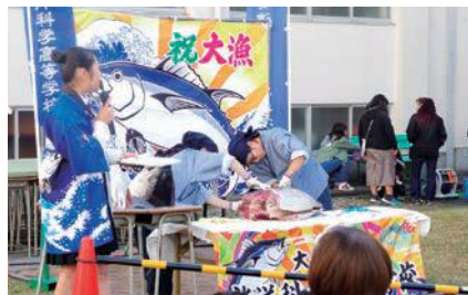
マグロの解体ショー