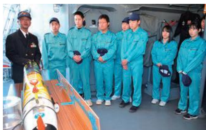
機雷探索機器の説明

12月13日、臼杵港において、1年生が海上自衛隊「掃海艇ながしま」の艦内見学を行いました。ブリッジや機関室の艦内見学や消火ホースを使った放水体験をするとともに、掃海艇の主な業務である機雷の探索から除去作業について説明を聞きました。また、生徒たちは、機雷の仕組みや掃海艇はなぜ木造なのかなど、各所でたくさんの質問をすることができました。