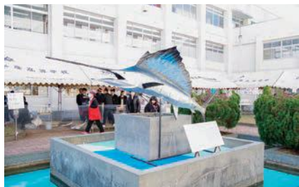
3年生の展示品バショウカジキの模型

11月16日、本校の一大イベントである海高祭が行われました。今年は「open～新たな時代へのトビラ～」をテーマに掲げ、生徒会による中庭イベントやマグロの解体ショー、実習製品の販売(缶詰、おさかな小判)、PTAバザーなど、例年以上の来場者を迎え入れ、大いに盛り上がりを見せました。また、今回は初の試みとして、プロのマジシャンによるマジックショーが行われ、生徒たちは間近に観るマジックにとっても興奮していました。まさに今年のテーマに相応しい海高祭となりました。