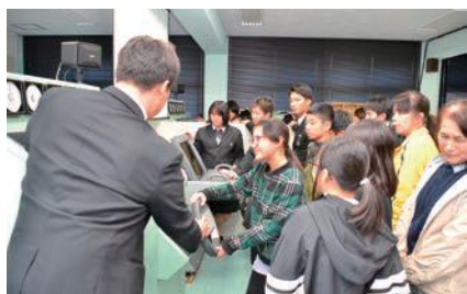
レーダーを見ながら模擬装船

11月21日、海辺小学校5、6年生が来校し、海洋科学高校の学習内容について見学・体験する高校探検を行いました。本校の3年生が校内の誘導案内や各授業内容の説明などを行いました。小学生にもわかりやすいように工夫を凝らし気遣う所は『さすが3年生!』といった姿でした。また、海辺小の児童たちもレーダーシミュレータや旋盤の見学、最後に今年導入された大型エンジンの運転体験を行い、児童たちからは「大きな音に驚いた。海洋科学高校をよく知ることができた」などの感想をいただきました。