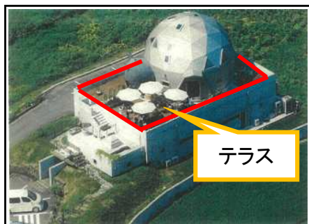
テラス部分も使用可