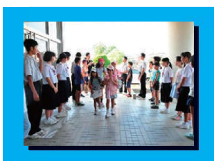
小学生と中学生が元気よく、一緒にあいさつ運動に取り組みます