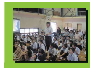
小中学生と保護者や地域の方が一緒に人権について考え、学びます