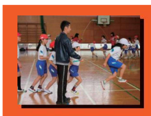
長縄で時間内に何回飛べたか、何回伸びたか等を競い、体力向上をめざします