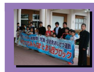
中学生と小学生と一緒にあいさつ運動を行います