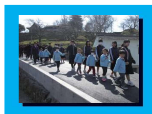
小中一貫したカリキュラムをもとに防災教育に取り組みます