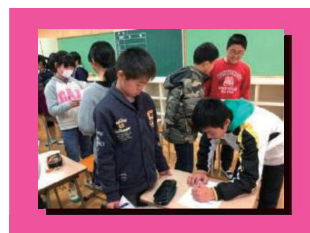
小学校6年生が3学期中学校へ行き中学校の授業を体験します