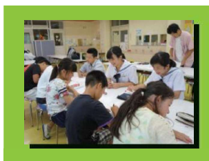
中学1年生が小学校に戻り勉強を教えます