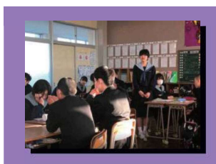
「話し合い」と活用して話し合い活動を充実していきます