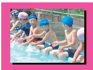
小小連携して合同授業や行事行って中学に行く前のつながりを作ります