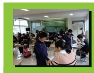
小学校の先生が中学校の先生とともに中1と中2の弱点補強を行います