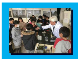
中学校の先生が小学校へ行き、専門的な楽しい授業をします