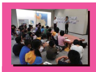
6年生が3校合同で歴史資料館見学を行い、中1ギャップ解消をめざします。