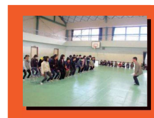
中学校の音楽の先生が小学校へ行き、専門的な合唱指導を行います