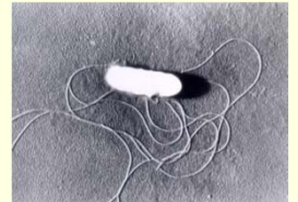
リステリアの顕微鏡写真（約0.5×1μm）

リステリア（リステリア・モノサイトゲネス）は、動物の腸管内や環境中に広く分布している細菌で、食品を介して感染する食中毒菌です。多くの食中毒菌が増殖できないような低温や高い塩分濃度の食品でも増殖します。