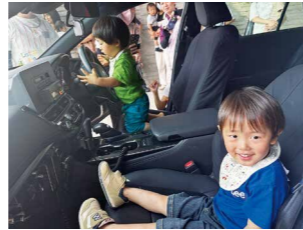
パトカー試乗の様子

※定期的な学習日のほか、6月・10月にはおさがりマーケット、夏休み・冬休みは家族で参加できる行事を企画予定です。日時・内容など詳しくは毎月の市報や市公式ラインでお知らせします。