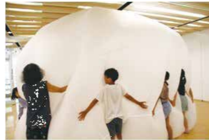
大分県立美術館見学の様子

対象 小学4年生～高校生（原則として年間を通じて参加できる方） 場所 臼杵市中央公民館、市内各地など 学習日 月1回（5月～3月）基本第3土曜日 10:00～12:00 参加料 無料（活動により実費負担あり） 定員 20名程度（定員超過の場合抽選）