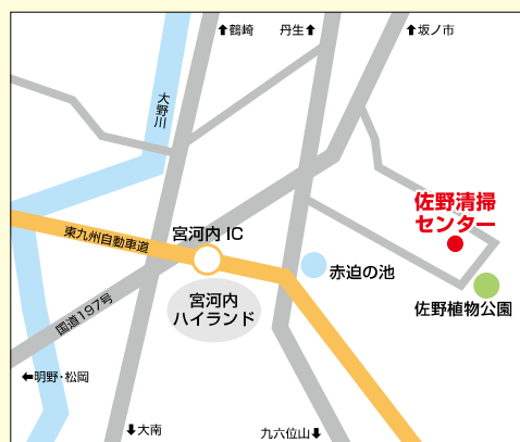
佐野清掃センター

※ただし、1回の搬入が350kgを超えるときは事業系ごみと同じ料金(10kgまでごとに105円)を適用。