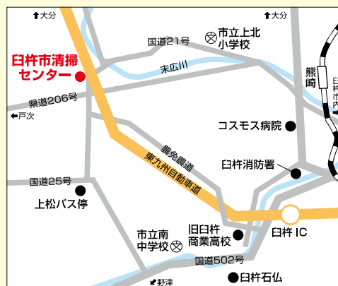
臼杵市清掃センター

※料金は、令和7年4月現在の金額です。消費税率等の改定等により変更される場合があります。