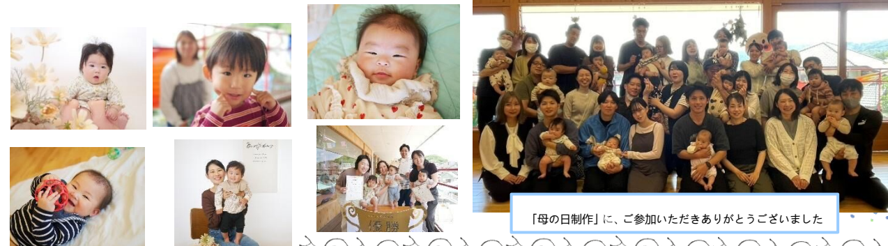
「母の日制作」に、ご参加いただきありがとうございました

ウスキッズ☆ kirakira☆スマイル☺ ウスキッズを利用して いただいている皆さんの 「Kirakira☆スマイル」 ご紹介いたします。