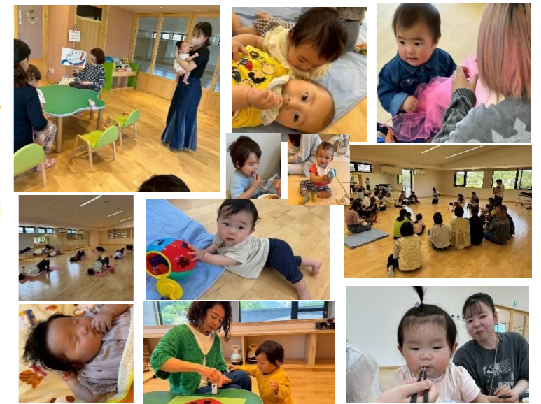
うすきねわくわく講座