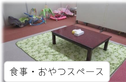
食事・おやつスペース

無料お下がり引き続き常設中です。棚の上にはシーズンの物を、中にはオフシーズンの物を収納しています。お話し会は長机&椅子スタイルでできるようになりました！イベントで部屋を使わない時には、走り回ったりボール遊びも楽しめる広さです☆