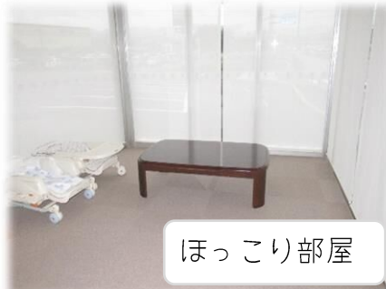
お話し会・食事・ヨガ部屋 お下がり常設展示

無料お下がり引き続き常設中です。棚の上にはシーズンの物を、中にはオフシーズンの物を収納しています。お話し会は長机&椅子スタイルでできるようになりました！イベントで部屋を使わない時には、走り回ったりボール遊びも楽しめる広さです☆