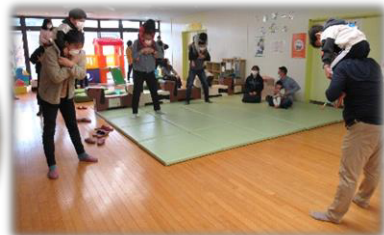
肩車をしながら体重移動@体幹鍛えよう!(↑) (↓)終了後はよいこのへやでお悩み相談