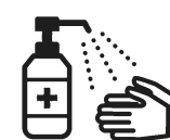
手指消毒用アルコール による消毒の励行

新型コロナワクチンの詳しい情報については、厚生労働省のホームページをご覧ください。