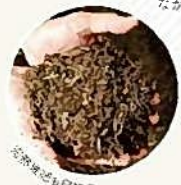
完熟苜菜の白杵産

野津川の豊富な水質の恩恵を受ける、農業が盛んな地域です。また白杵市は「有機の里」をキャッチフレーズに、草本を主原料にした完熟苜菜による土づくりを推奨しながら、有機農業にも力を入れています。有機農家さんの多くは野津で従事しています。