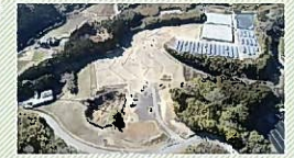
▲造成中のパークゴルフ場