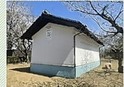
▲増設予定の臼杵公園防災倉庫