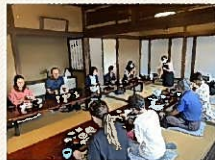
▲臼杵食業アンバサダー養成講座の様子