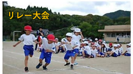
約一か月の練習で臨むリレー大会、全校の心とバトンがつながります。