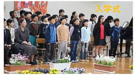
入学式、全校児童の大きな歌声で新入生を迎えます。