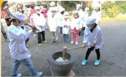
収穫米で餅つき（南っ子祭）