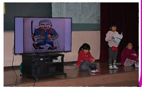
工夫を凝らした集会活動