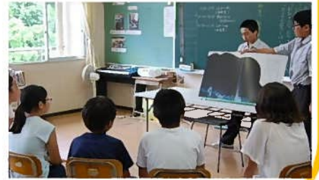
中学生による読み聞かせ