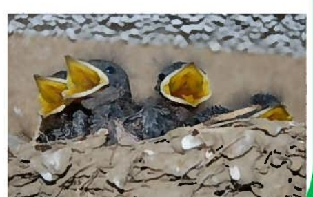
燕の巣立ちも見送りました。