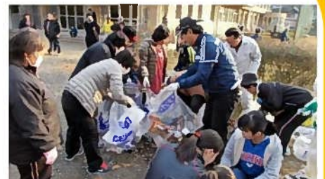
地域の方々と地域一斉清掃