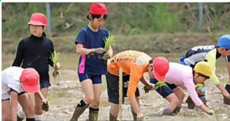
近くの田んぼでお米作り