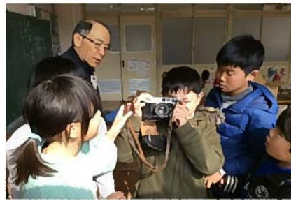
地域のゲストティーチャーを招いて