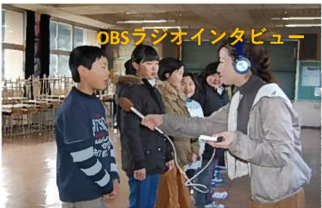
OBSラジオインタビュー