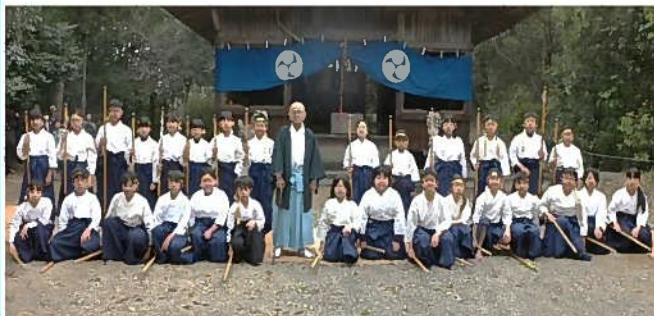
校区に残る新要流棒術をずっと受け継いでいます。