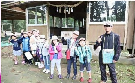
縦割り班でのいろいろな活動