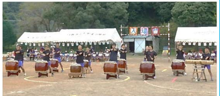
「南小太鼓」は代々6年生が引き継いでいます。