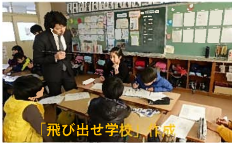
「飛び出せ学校」作成