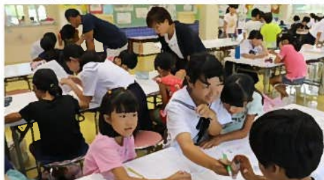
夏休みには中学生が勉強を教えてくださいます。