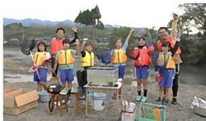
近くの川で生き物調べ