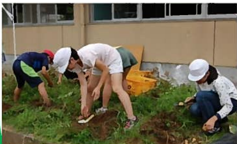
学校農園でジャガイモ作り