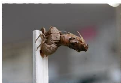
セミの脱皮も観察できます。