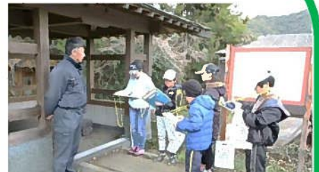
外部講師を招いての校区史跡巡り