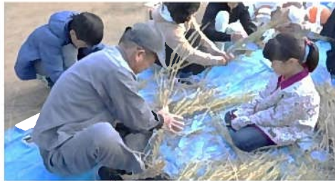
藁を使って縄づくり（南っ子祭）