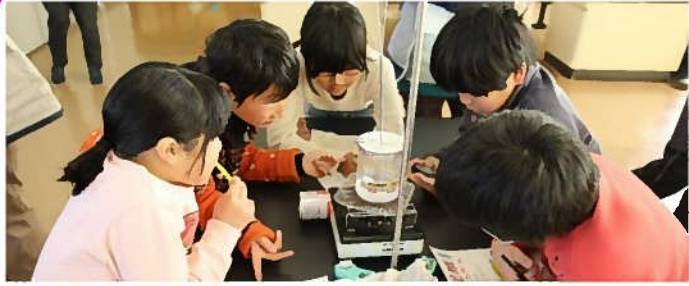
一人一人が活躍できる授業を行っています。