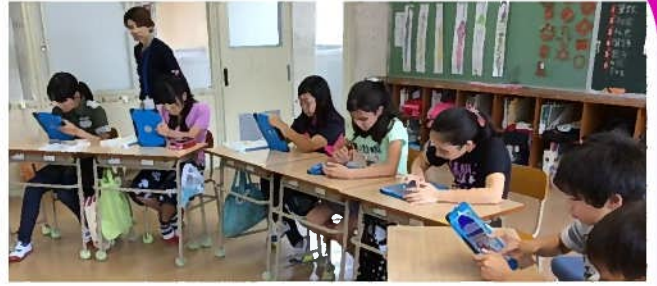
授業では一人一台のタブレットを活用できます。