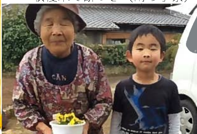
地域のお年寄りへの花プレゼント