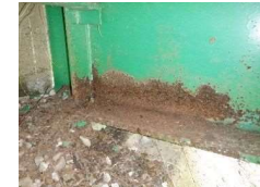
主桁：防食機能の劣化・腐食