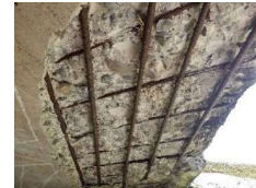
主桁：剥離・鉄筋露出