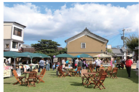
サーラ・デ・うすき にぎわい広場