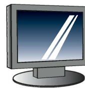
液晶ディスプレイ(一体型含む)