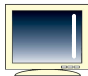
CRTディスプレイ(一体型含む)