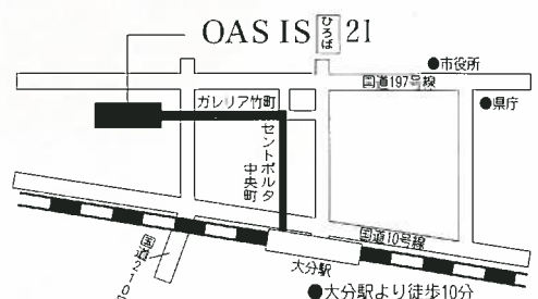
大分県パスポートセンター地図