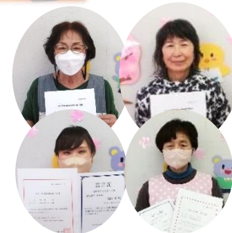
昨年の受講者。 今年も2名が受講予定。

“よいこのへや”は、白津地域シルバー人材センターが運営している “地域子育て支援拠点”です。退職後、第2の人生としてシルバーに 入会し、現在16名の会員が登録しています。(+ママスタッフ2名) 保育園・幼稚園の先生だった、学校の先生だった、全く違う仕事を していたなど、入会前の職種は様々ですが、 今、ここでは、子育て支援のスタッフ。 使命感と責任感をもって皆さんと関わるため、学びの機会を とても大切にしています(*^^)v 昨年は右の4名が“子育て支援員研修”で、資格を取得。 “今の私が一番若い!”我が孫のように、お子様の成長を喜び、 子育て中のみなさんをお助けしたい、“スーパー応援団”です(*^^)v