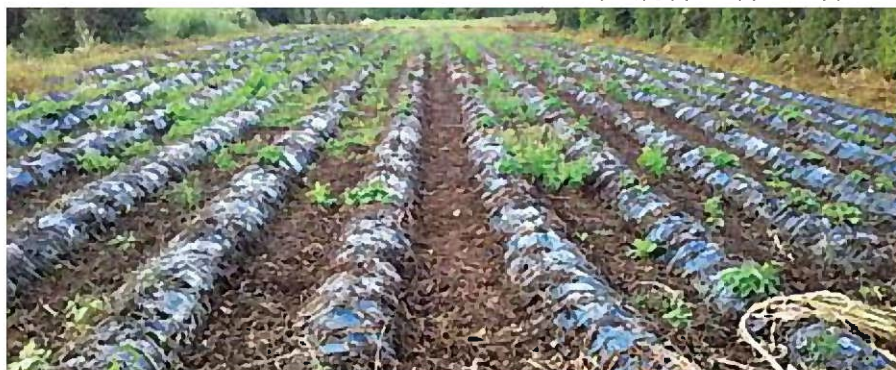
全滅した圃場: 生き残ったイモの一部が再生と枯死を繰り返す