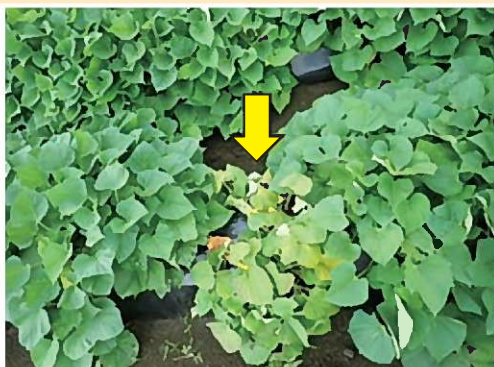
発病初期: 巻葉、褪色、株の萎縮